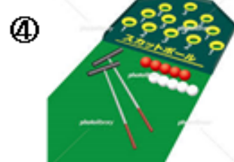
体験コーナー・カーリングコン